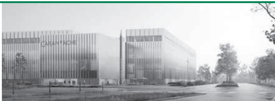
Projet architectural de l'entreprise Caran d'Ache prévu dans la zone

lement créé que le transit des camions s'effectuerait;