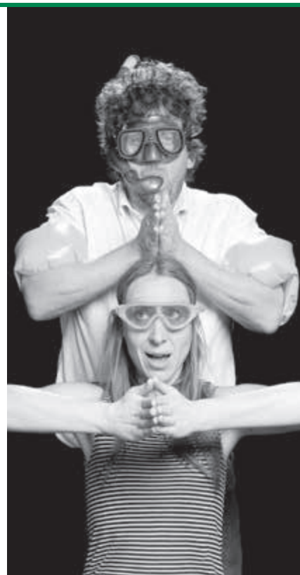
Cie La Parlote

C'est l'histoire de toutes les petites choses du monde qui procurent des