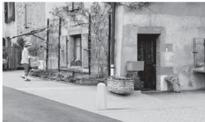
Chemin du Creux