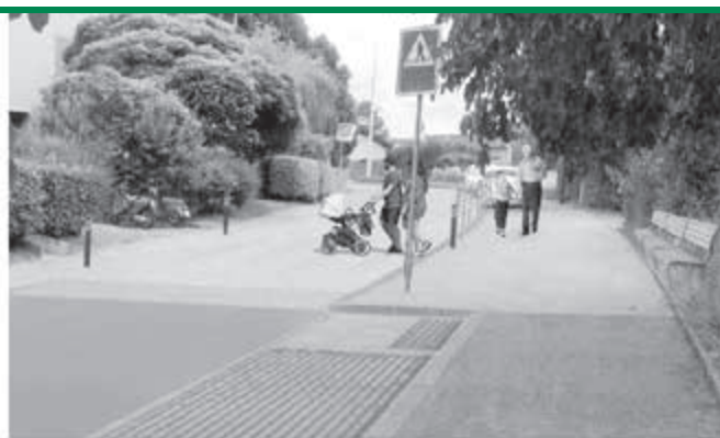
Chemin de Saule / Robert-Hainard