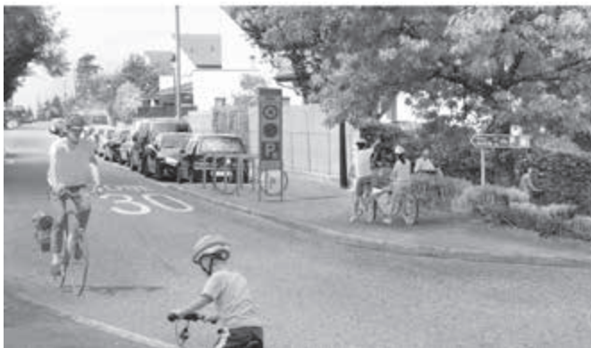
Chemin de Saule / Route d'Aire-la-Ville