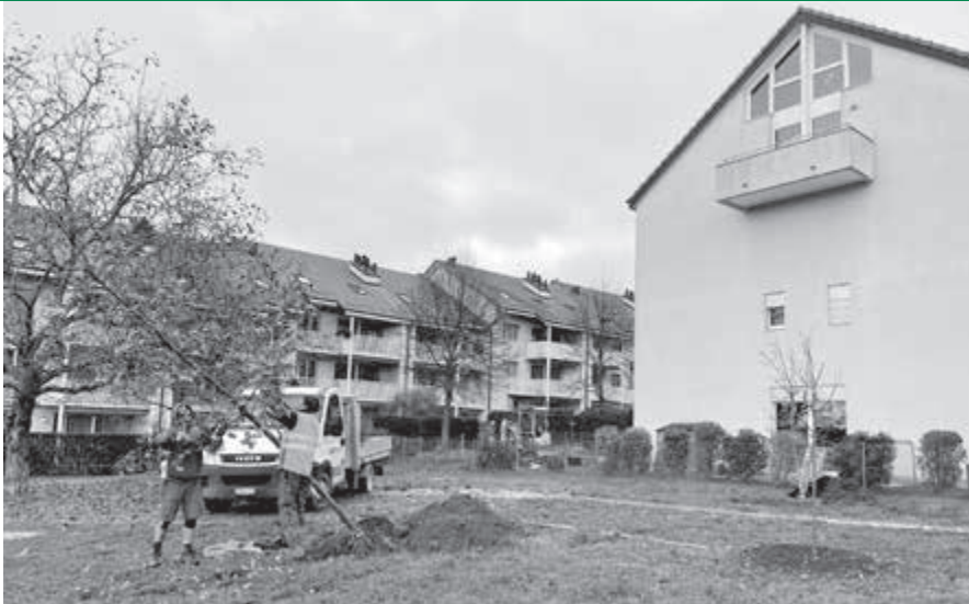
Plantation sur la parcelle de la copropriété de Mme Brossy voisins qui ont rejoint la démarche en plantant également des arbres dans leur jardin.

Puis avec l'accompagnement auprès des particuliers qui a permis la plantation de 46 arbres.