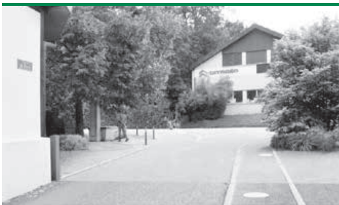
Chemin de Saule / Chemin de Paris