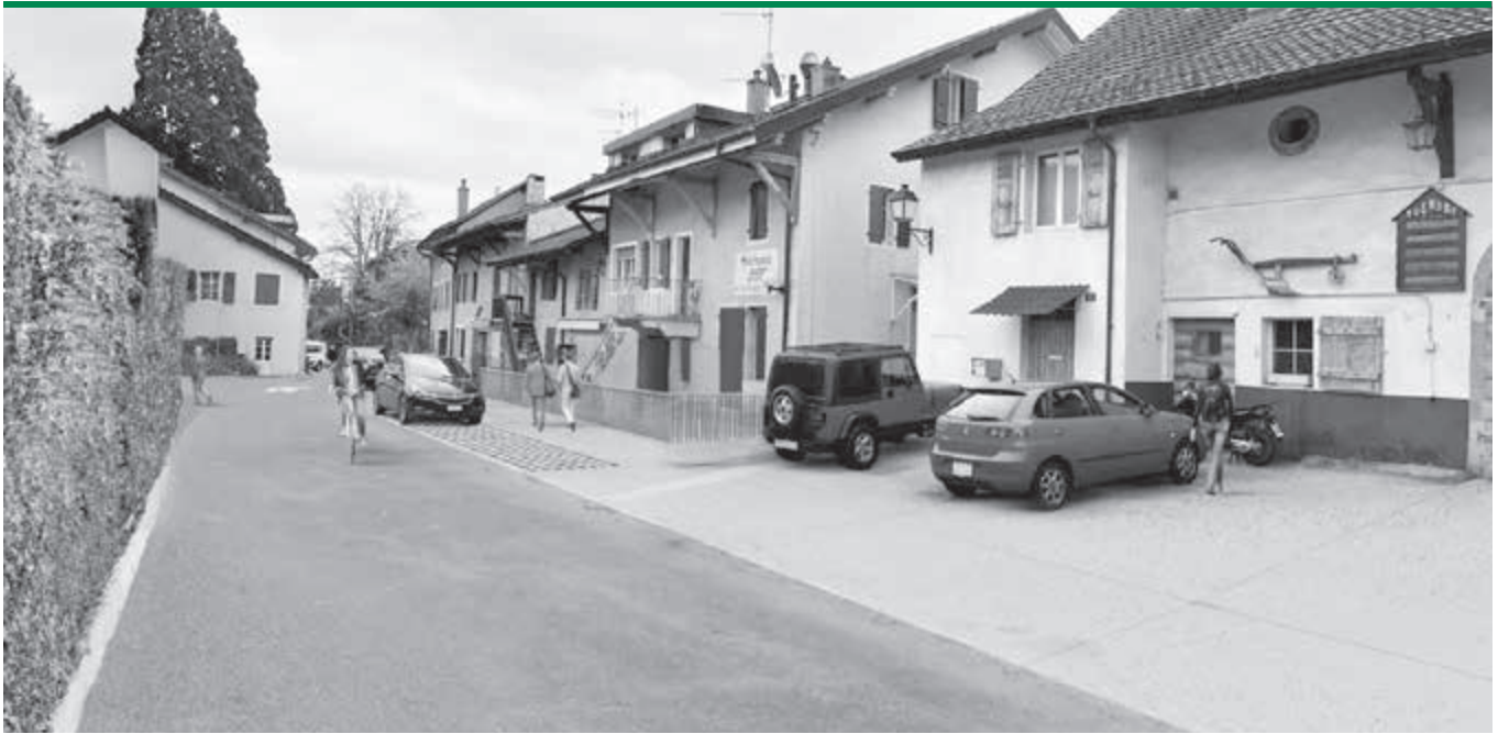
Chemin de la Distillerie

routier a une incidence directe sur la vitesse des automobilistes et, par répercussion, sur le sentiment de sécurité des piétons. En outre, la zone 30 découlant d'une philosophie où tous les modes de mobilité cohabitent en harmonie, nous n'avons pas créé d'aménagements dédiés aux cyclistes.