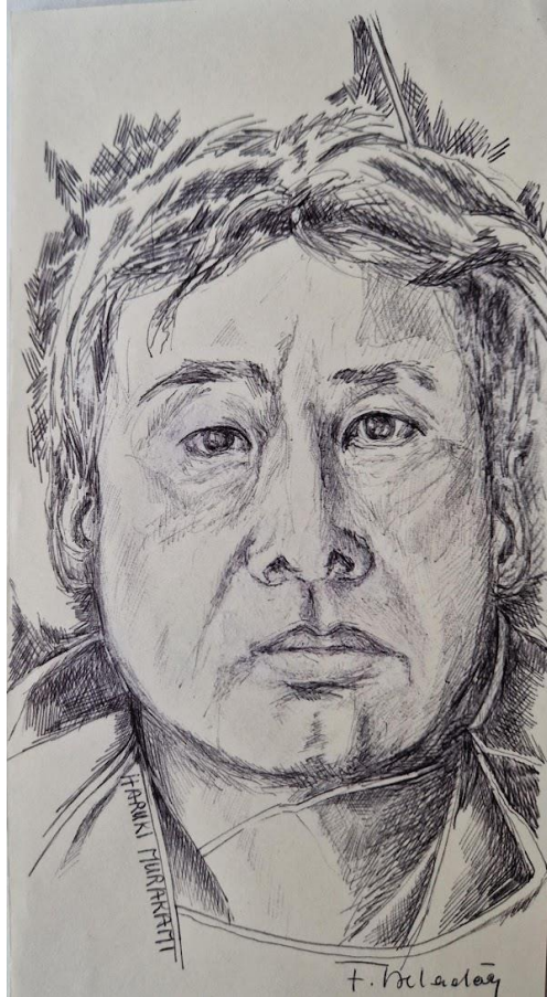
Haruki Murakami / Écrivain, pointe fine