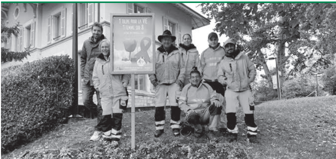
L'équipe des jardiniers et jardinières de Bernex